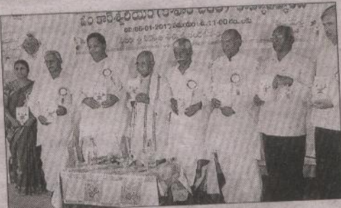
పుస్తకావిష్కరణ చేస్తున్న దృశ్యం